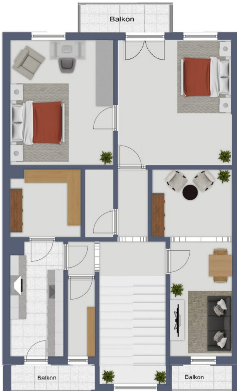
Grundriss 2. OG als schematische Darstellung