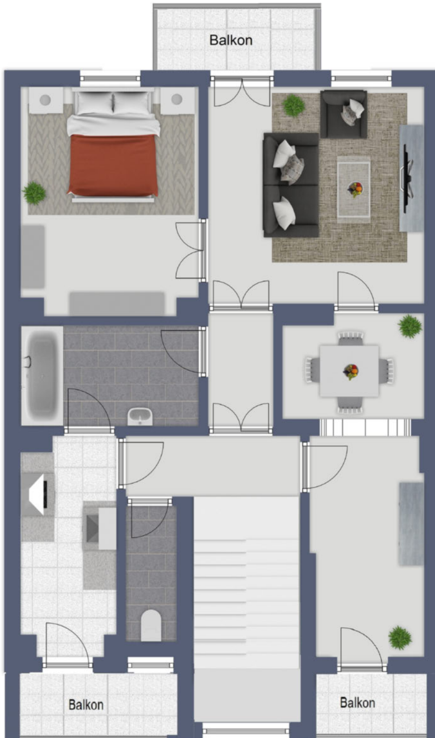
Grundriss 1. OG als schematische Darstellung