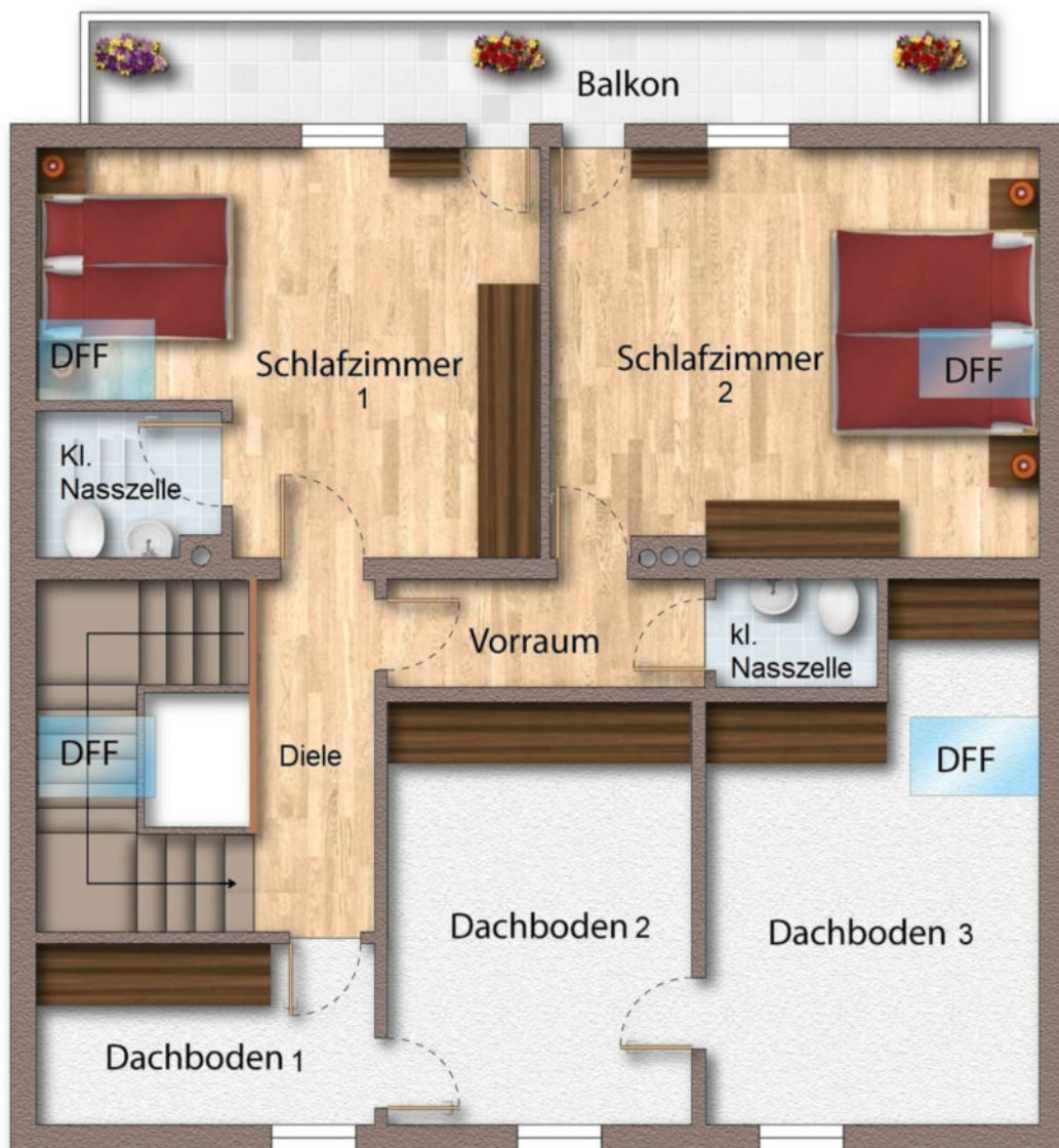
Grundriss als schematische Darstellung