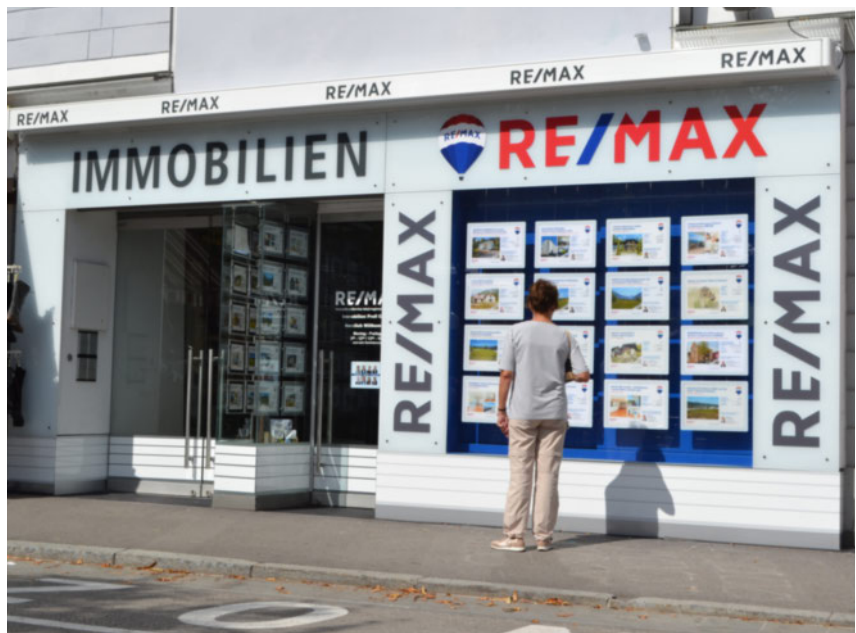
RE/MAX Büro Bad Ischl, Esplanade 4