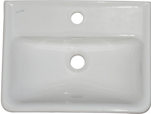
Handwaschbecken Laufen Pro 1195.1 45x34 cm weiß