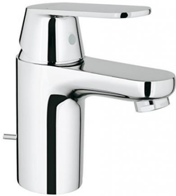
Grohe eurosmart cosmopolitan WT-Mischer