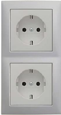
Berker S.1 Abdeckrahmen, Polarweiß