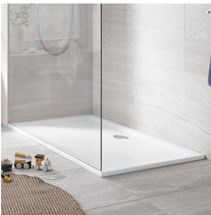
Duschwanne und Duschglaswand