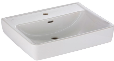
Laufen Pro A 1895.2 Waschtisch 60x48 cm