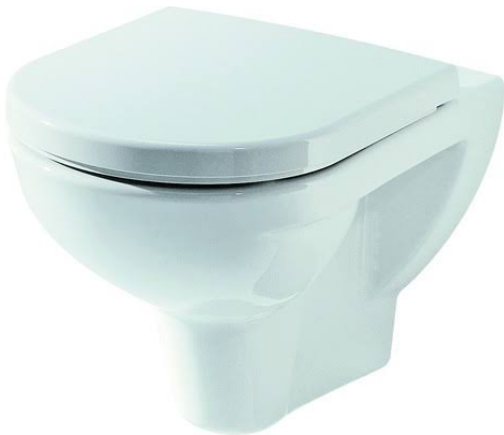
Wandtiefspülklosett Laufen Pro 2095.0 Abgang waagrecht weiß