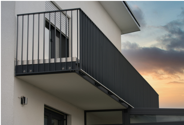
Balkonengeländer - Verzinkt und Pulverbeschichtet Farbe Anthrazit.