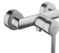
Einhebelmischer „Ronda Neu“