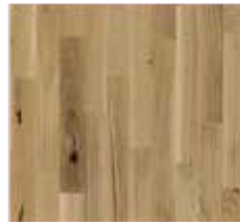
2-Schicht-Parkettboden „Eiche Business“