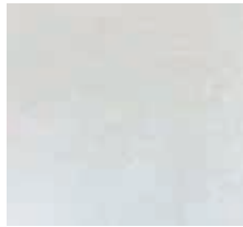
Wandfliese weiß, matt