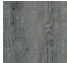
Vinylboden „Old Grey Oak“