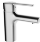
Einhebelmischer „Ronda Neu“