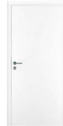
INNENTÜREN: Weiß lackierte Röhrenspan- Holztürblätter auf Holzzargen angeschlagen