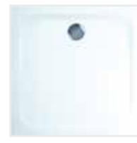
Duschtasse 90 x 90 cm Mineralguss