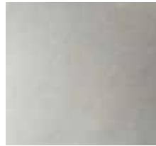
Fliese Domino Newstreet „Pearl“