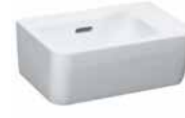
Handwaschbecken „Laufen Pro A“, 36 x 25 cm