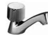
Standventil „Nova“ einfach