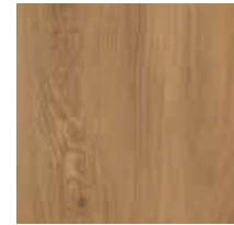
Vinylboden „Fresh Oak“