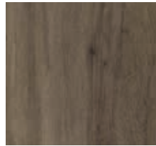
Vinylboden „Airy Oak“