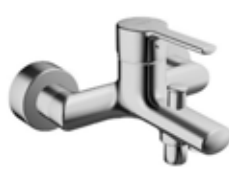
Wannen-Einhebelmischer chrom, „Hansa Ronda Neu“