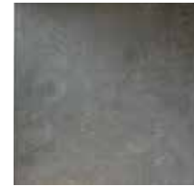
Fliese Domino Newstreet „Smoke“