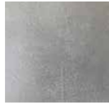
Fliese Domino Newstreet „Fog“