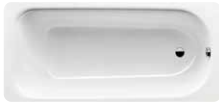
Stahlwanne „Kaldewei Körperform“, 170 x 75 cm