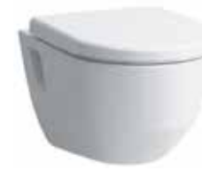
Tiefspül-Wand-WC „Laufen Pro“ spülrandlos