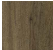
Vinyl-Boden „Airy Oak“