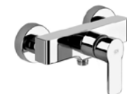
Einhand-Brausebatterie „Gessi Corso Venezia“