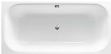
Badewanne „Vigour Derby“, Stahl-Email, 170 x 75 cm