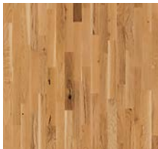
2-Schicht-Parkettboden „Eiche Business“