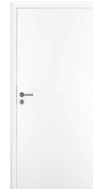
INNENTÜREN: Weiß lackierte Röhrenspan- Holztürblätter auf lackierten Stahlzargen