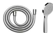
Brausegarnitur für Badewanne