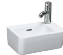
Handwaschbecken „Laufen Pro A“, 36 x 25 cm