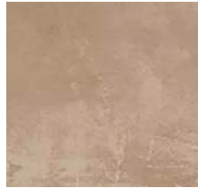
Fliese für Bäder/Toiletten „TAUPE“