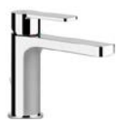
Einhand-Waschtischmischer „Gessi Corso Venezia“