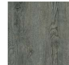
Vinyl-Boden „Olad Grey Oak“