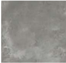
Fliese für Loggien/Balkone „Urbana Grigio, strukturiert“