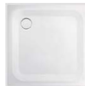
Brausetasse „Vigour Derby“, 90 x 90 cm mit ca. 3 cm Höhe über Fliesenbelag