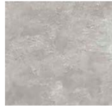
Fliese für Bäder/Toiletten „ASH“