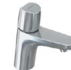
Standventil „Vigour Derby“ (nur Kaltwasser)