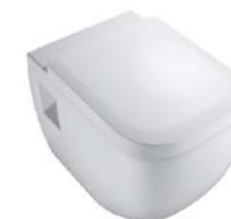
Wand-WC „Vigour Derby“, spülrandlos, WC-Sitz abnehmbar mit Absenkautomatik