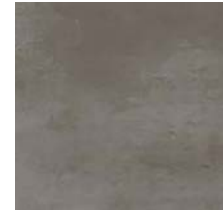
Fliese für Bäder/Toiletten „GREY“