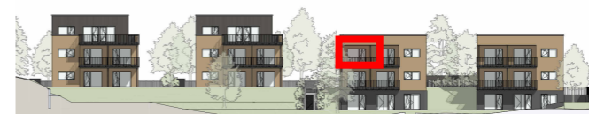
R4 R3 R2 R1