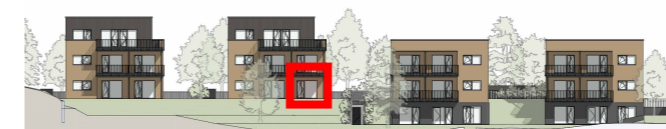
R4 R3 R2 R1