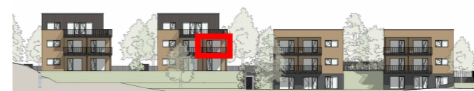
R4 R3 R2 R1