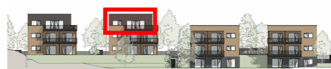
R4 R3 R2 R1