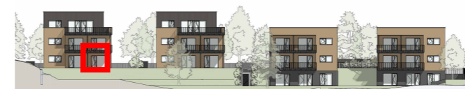
R4 R3 R2 R1